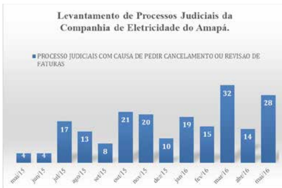
Gráfico 02 - Quantitativo de demandas judiciais de maio de 2015 a maio de 2016.

Na pesquisa também se obteve acesso, através da Procuradoria Jurídica da CEA, ao número de Processos Judiciais respondidos pela Companhia de Eletricidade do Amapá com causas de pedir envolvendo reclamações de faturas no período de cinco meses antes e cinco meses depois do surgimento da lide, e constatou-se, conforme quadro abaixo: